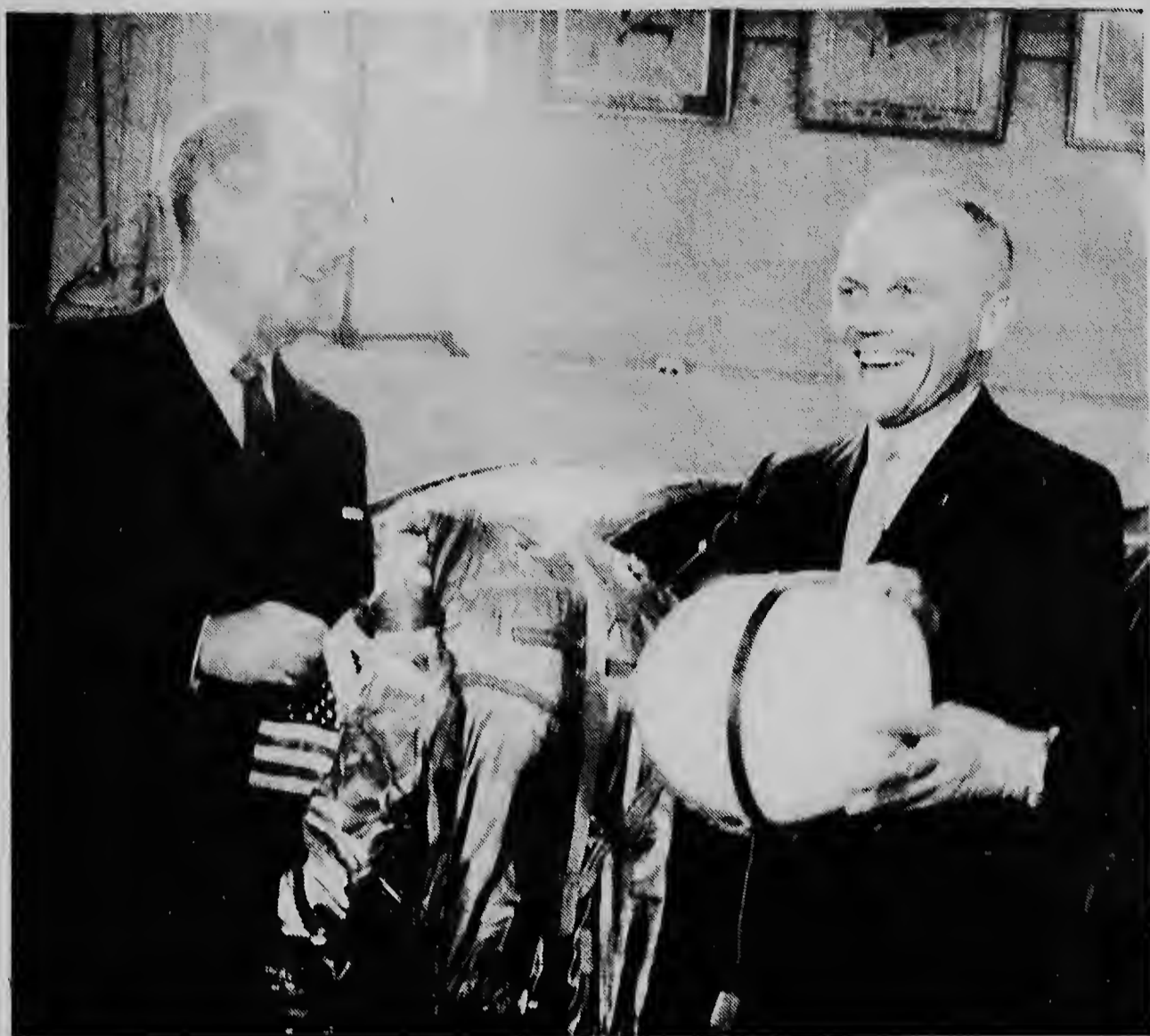
E astronauta Mericano John Glenn (drecht) ta ofrece su uniforme cu el a bisti durante su vuelo den espacio na e bisti dur...